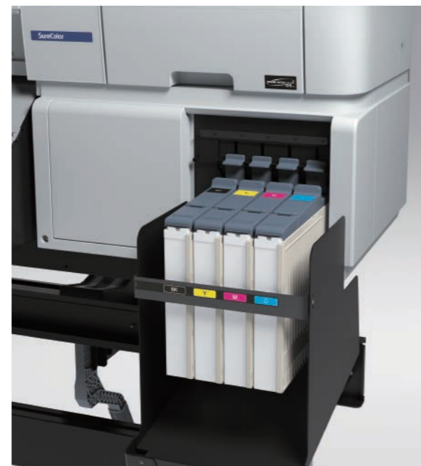
大容量1.5公升墨水槽，青、洋紅、黃、黑四色。

SC-F系列提供 1.5 公升墨水槽搭配墨水補充包，除了可以滿足大量列印生產時，減少更換墨水匣的次數的需求外，還能在列印過程中，透過墨水補充警示系統，提醒使用者適時更換墨水晶片與補充墨水。墨水槽濾網的設計，可以保護噴頭免於雜物進入以及延長噴頭壽命，讓您的列印過程更順暢，不再因停機而減少商機。