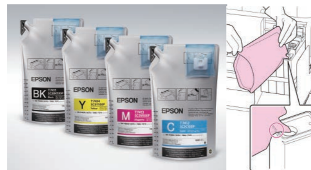
1公升補充包，隨包搭配感應晶片，晶片需隨同墨水一起更換，當墨水槽內的存量不足時，會透過晶片啟動警示燈號。