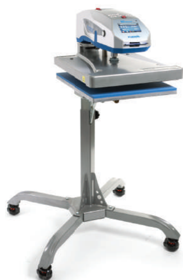
AIR FUSION™ 氣動式熱壓機-落地式支架