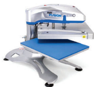
AIR FUSION™ 氣動式熱壓機-檯面式

122cm長 x 102cm寬 x 147cm高 · 111kg 附40 x 50cm快速切換底板